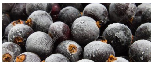
Feketeribizli 90% 10 kg, 1 kg