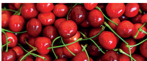
Meggy 90% 10 kg, 1 kg