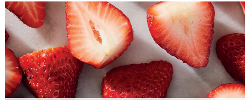
Eper 100% 1 kg