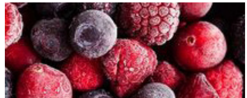
Erdei gyümölcs 82,5% 1 kg