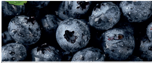
Áfonya 100% 1 kg