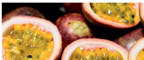
Maracuja 85% 1 kg