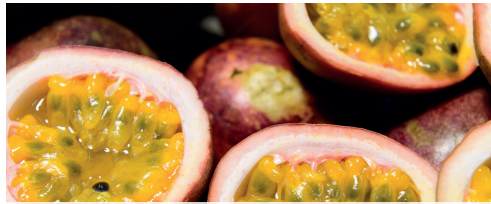
Maracuja 100% 1 kg