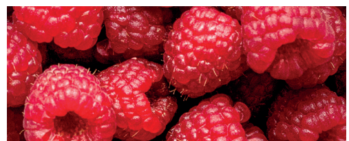
Málna 85% 10 kg, 1 kg