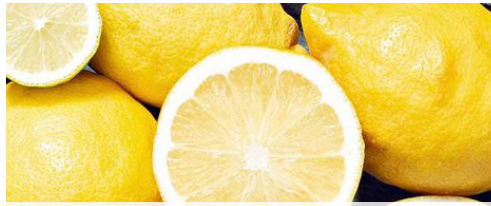
Citrom 100% 1 kg