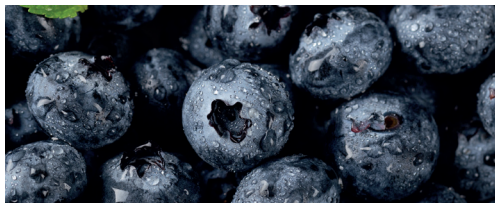
Áfonya 82% 1 kg