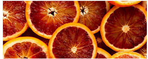
Vérnarancs 100% 1 kg