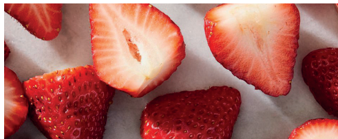
Eper 84% 1 kg