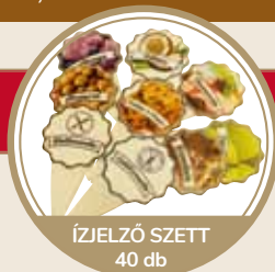
ÍZJELZŐ SZETT 40 db